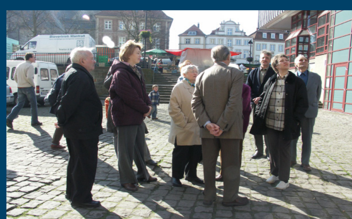
Die Gäste beim Stadtrundgang durch Paderborn.