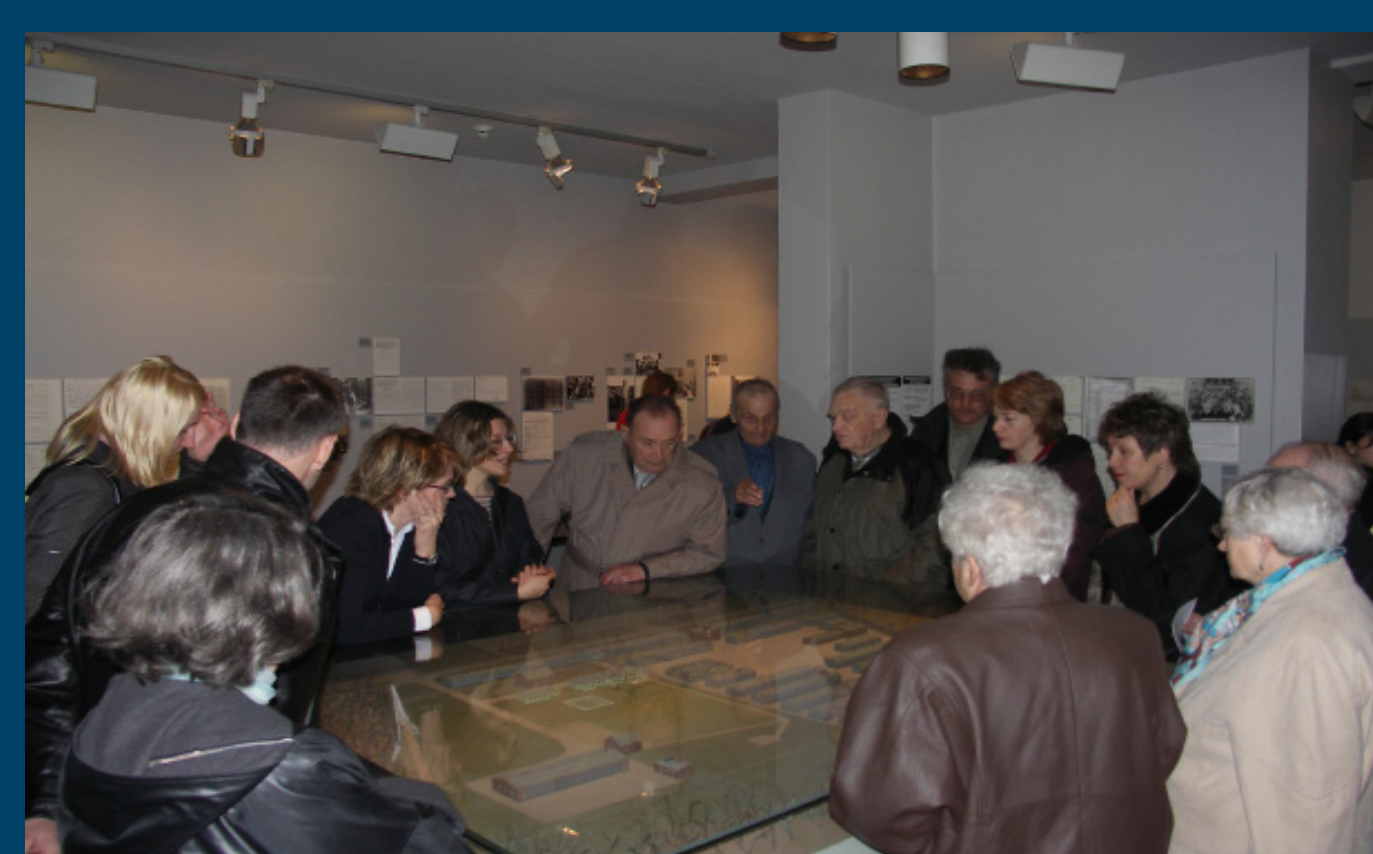
Diskussion vor dem KZ-Modell in der Gedenkstätte.